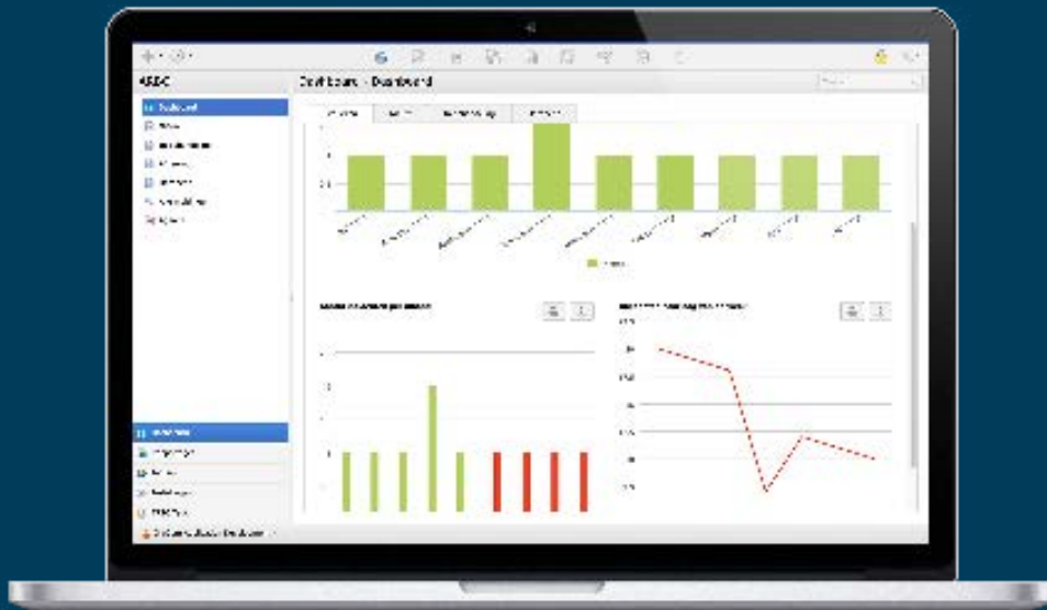
Dashboard, ARBO app

Via persoonlijke managementdashboards heeft u real-time overzicht van de ARBO incidenten, hun status en doorlooptijden. Door middel van vooraf ingestelde templates creëert u met één druk op de knop de gewenste maand-, kwartaal- of jaarrapportages.